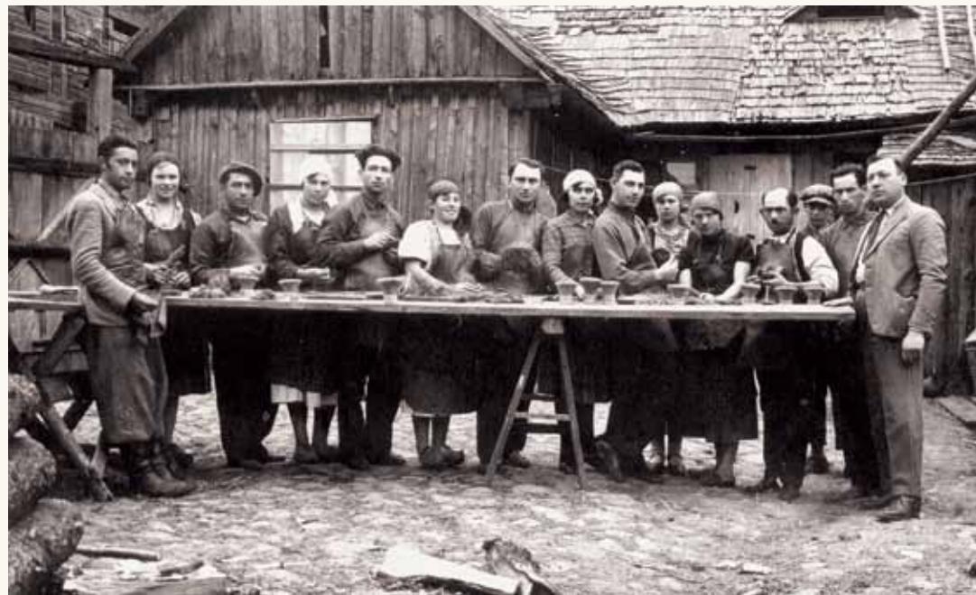
Žydų amatininkų šepečių dirbtuvė 1938 m., Žemaitija.