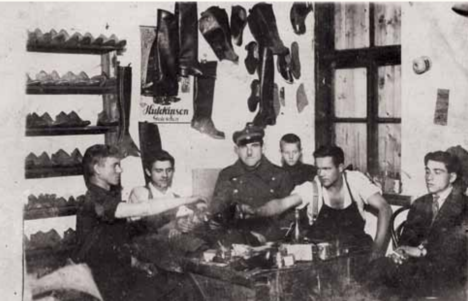
Taruko „Bato“ dirbtuvė 1925 m. Žeimelyje (Pakruojo r.). Kompaktinis diskas „Žeimelis“ (anglų k., sud. Barry Mann).