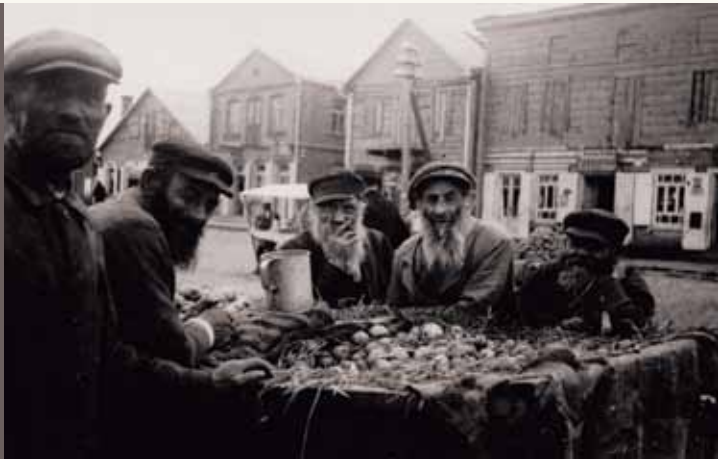
Vabalninko (Biržų r.) miestelio žydai turguje, XX a. 4 deš.