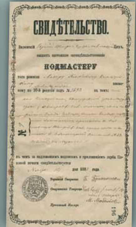
Vilniaus žydų moterų mados siuvėjų cecho liudijimas ir antspaudas, 1883 m. LVIA